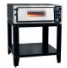
Печь для пиццы AVAT ПЭП-4